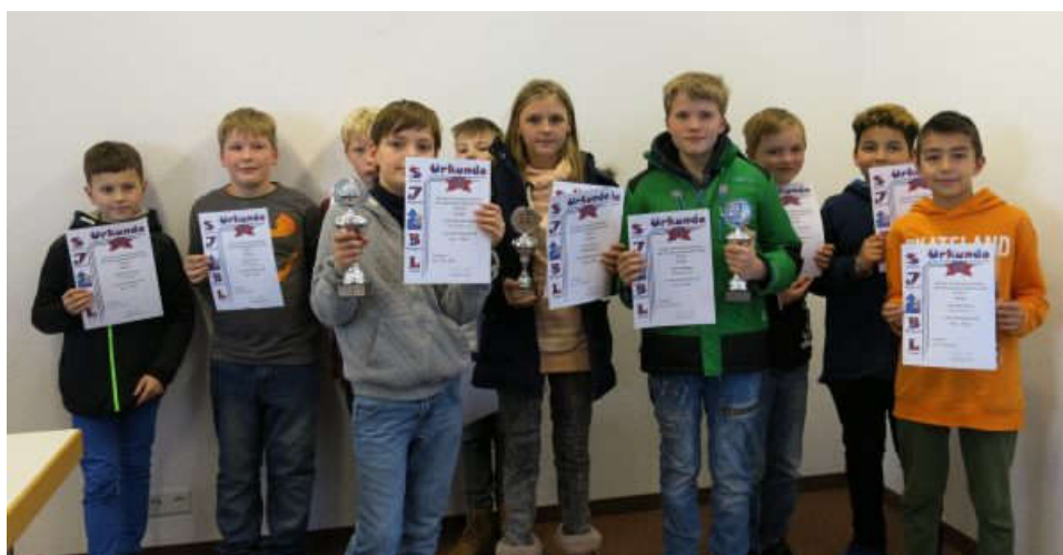
Fortschrittstabelle: Stand nach der 7. Runde (nach Rangliste)